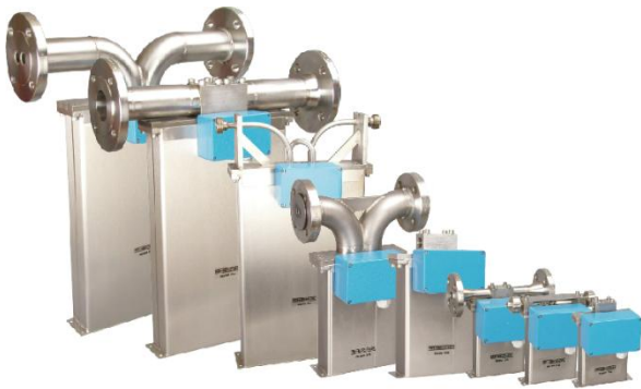
Einige der verfügbaren Sensoren