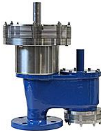
Beatmungsventils mit integrierten Flammensperren